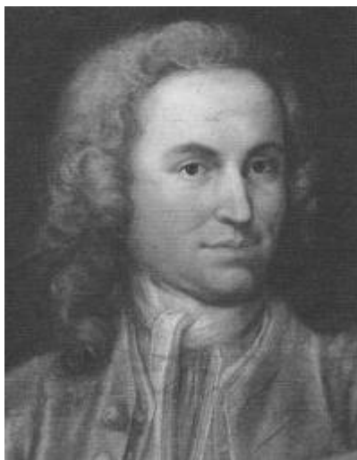
Bach als jonge man

Toen Bach overleed in 1750 werd zijn muziek daarna bijna niet meer gespeeld. Maar in de 19 e eeuw is hij opnieuw ontdekt door de componist Mendelssohn, die de Matthäus weer ging opvoeren. Al gauw werd Bach populairder dan hij ooit was geweest.