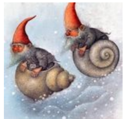
Twee vluchtende kabouters